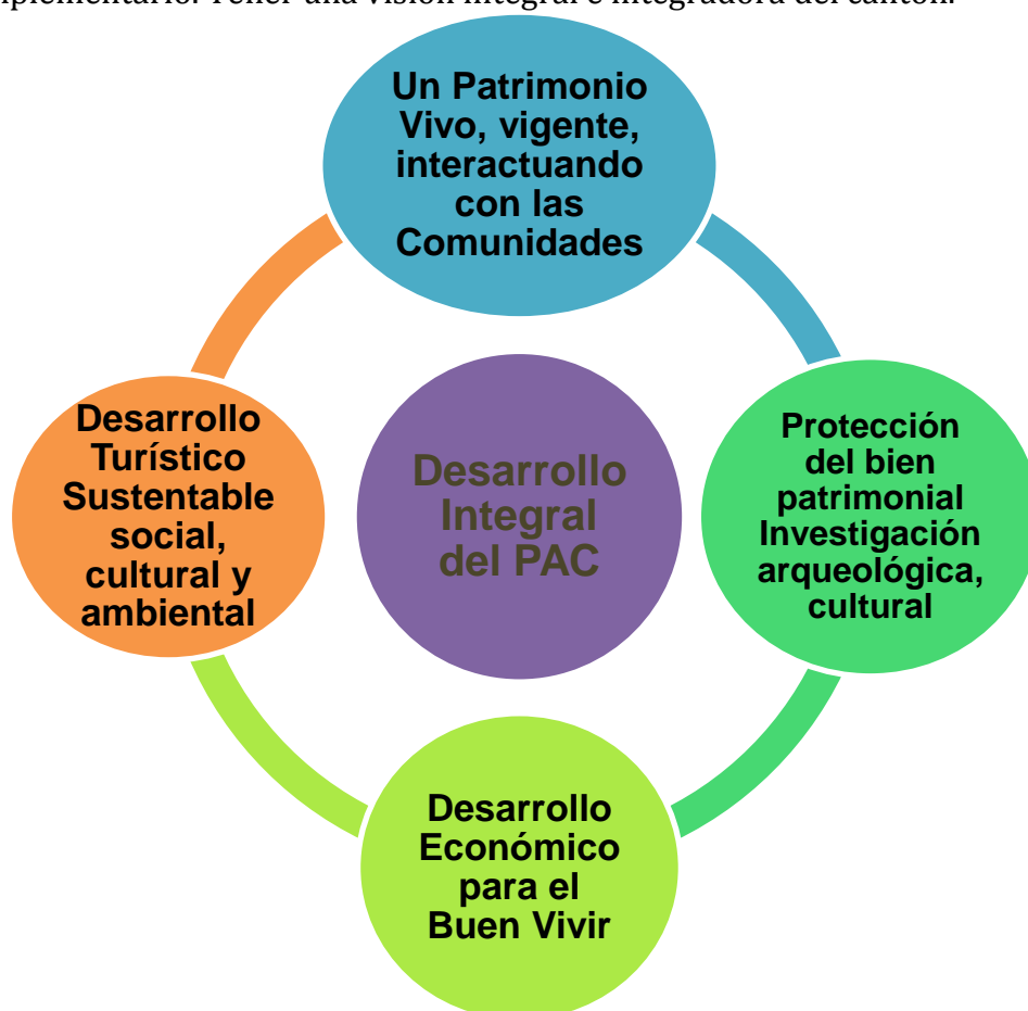
Gráfico 1: visiones institucionales sobre el PAC