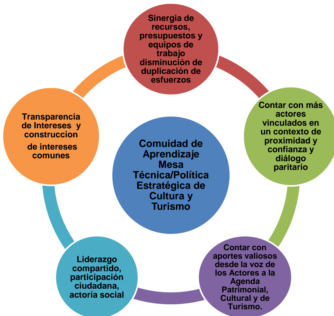
Gráfico 2: Potencialidades de la Mesa Técnica