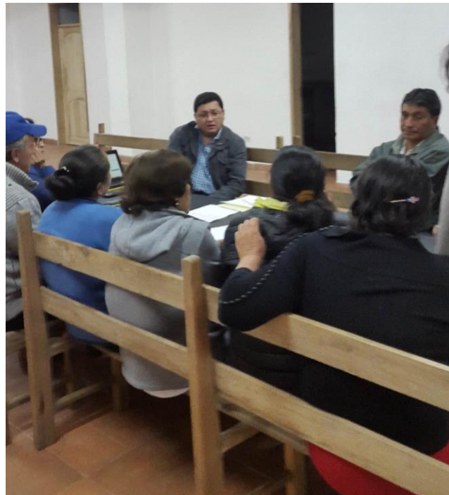
REUNION CON DIRECTIVA BARRIO VISTA HERMOSA