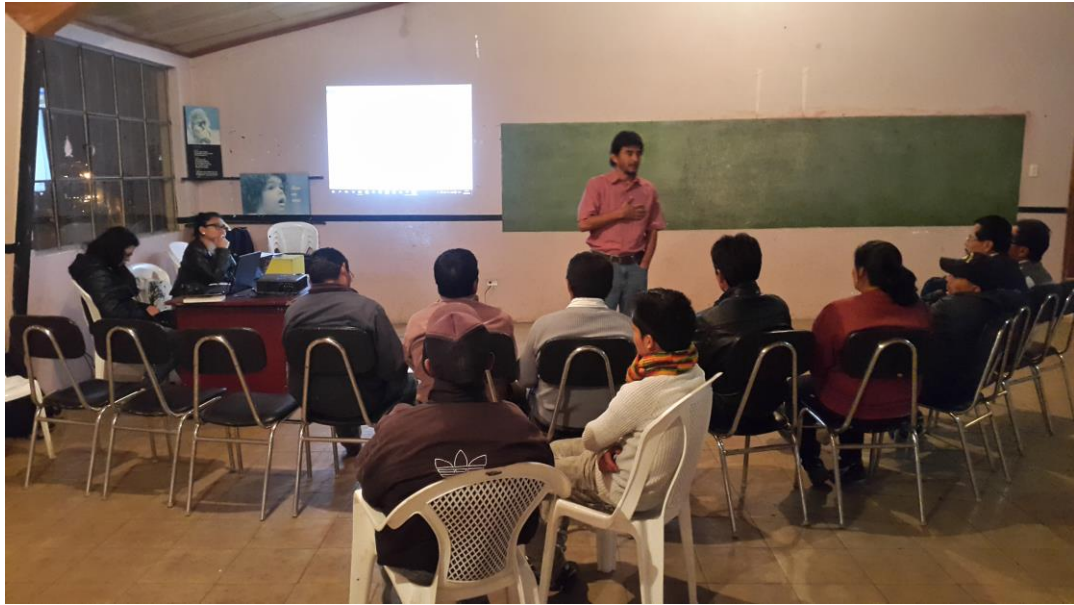
REUNION CON DIRECTIVA BARRIO VISTA HERMOSA