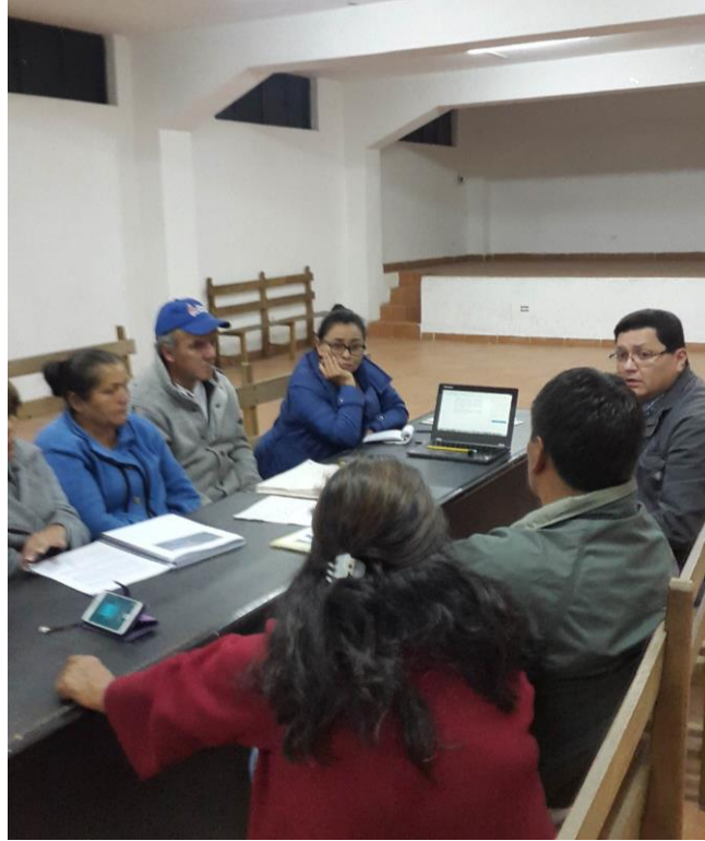
REUNIÓN CON DIRIGENTES BARRIO EL TRIGAL