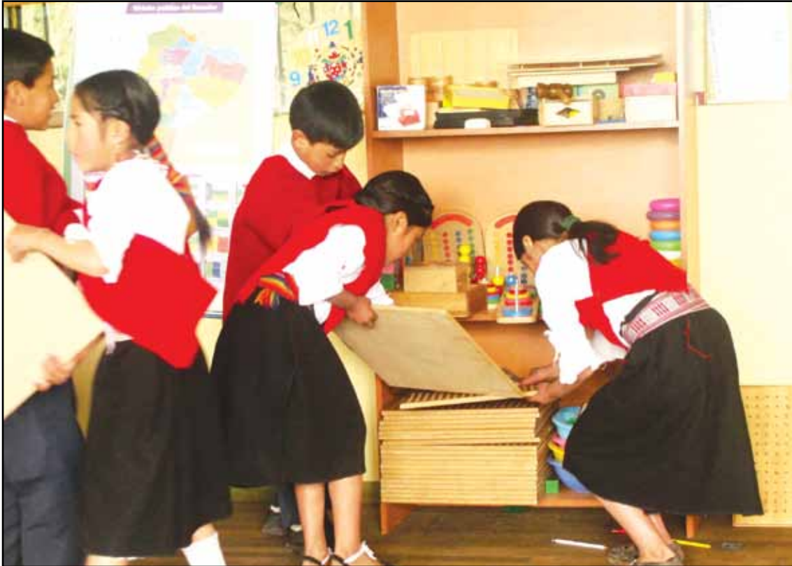
Centro Educativo Comunitario Intercultural Bilingüe Caupolican