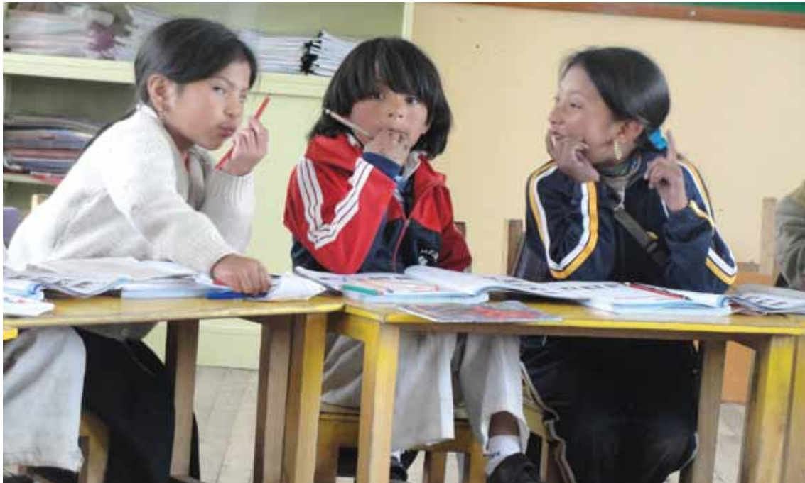
Centro Educativo Comunitario Intercultural Bilingüe Mushuk Ñan