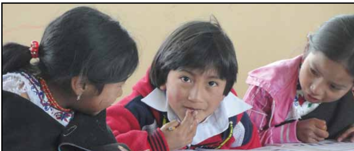
Centro Educativo Comunitario Intercultural Bilingüe Mushuk Ñan

La responsabilidad es un valor intrínseco del ser humano que actúa por convicción propia, no por miedo o por cumplir con el otro, lo hace convencido del valor de saber responder con compromiso por sí mismo y con los demás.