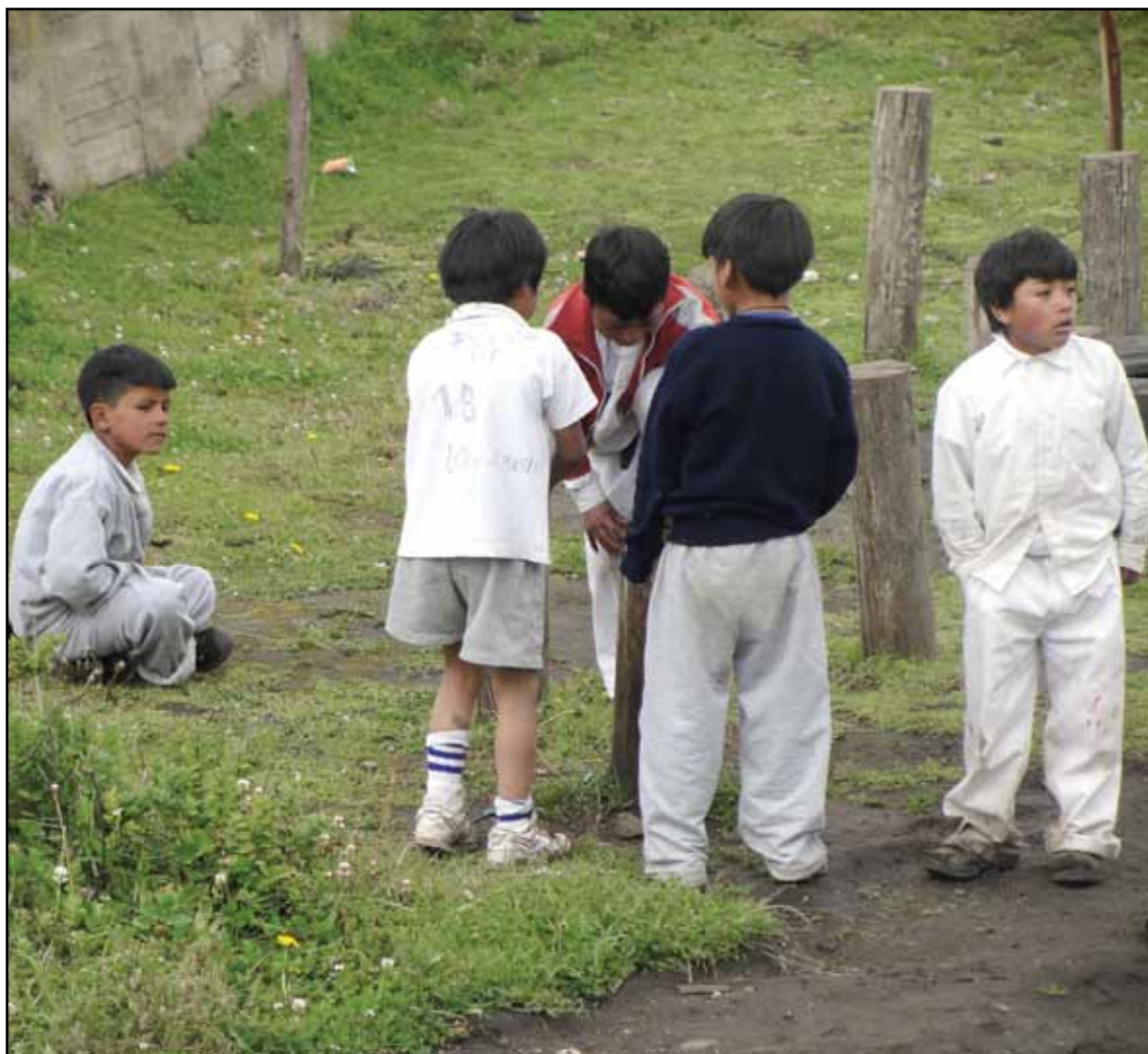
Centro Educativo Comunitario Intercultural Bilingüe Mushuk Ñan