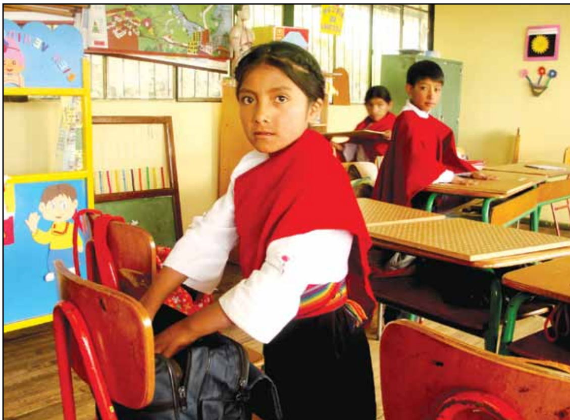
Centro Educativo Comunitario Intercultural Bilingüe Caupolican