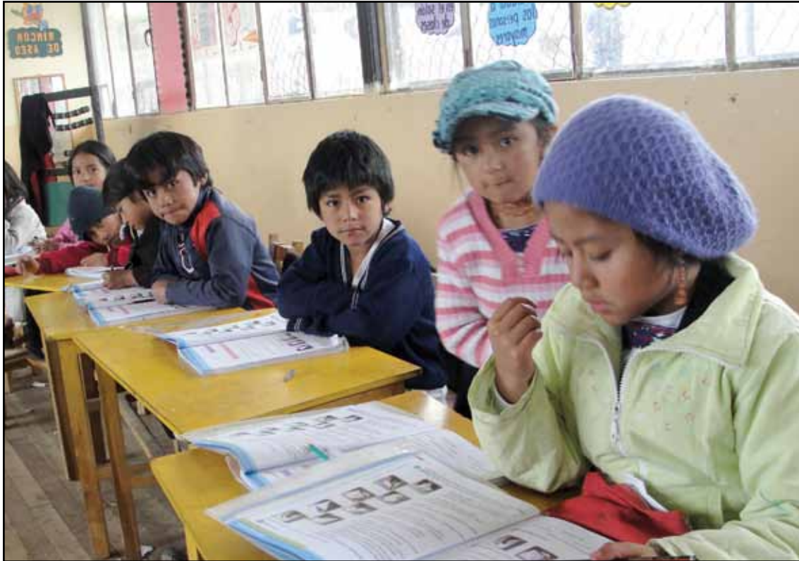
Centro Educativo Comunitario Intercultural Bilingüe Mushuk Ñan