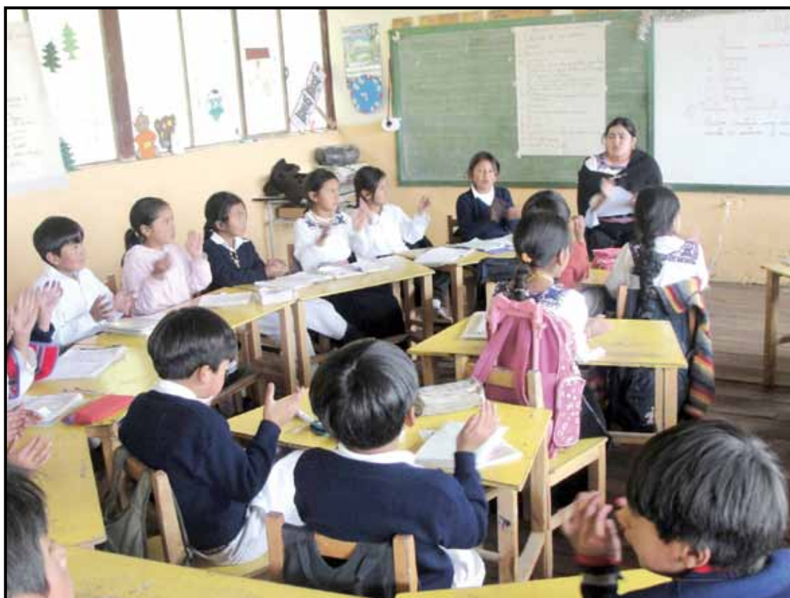
Centro Educativo Comunitario Intercultural Bilingüe Mushuk Ñan

Destrezas y competencias que propone el módulo