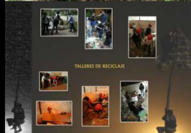
TALLERES DE RECICLAJE