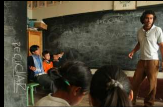
TALLERES MEDIO AMBIENTALES EN LA ESCUELA

Desde la particularidad a la generalidad. Dando todo tipo de detalles de quienes son los responsables del mismo y con que personas se cuentan para desarrollar todas las actividades. La inclusión o no de voluntarios, y el perfil de los mismos si se necesitan, la contratación de personal exterior al proyecto... etc.