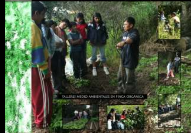
TALLERES MEDIO AMBIENTALES EN FINCA ORGÁNICA