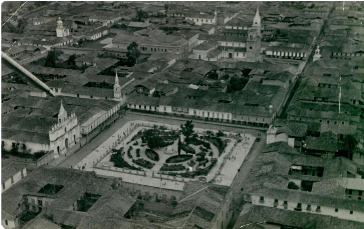
Fotopanorámica de Loja de antaño