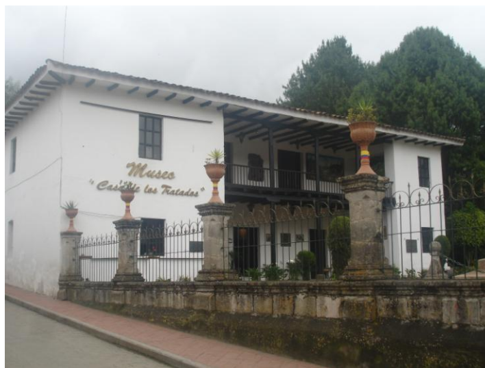
Museo "Casa de los Tratados" Girón

Los hijos de Girón participaron decididamente en la luchas independistas, es así que en la Batalla de Pichincha de los 800 soldados patriotas, 90 eran de Girón. Por esta razón, Sucre le nombra Cantón el 30 de diciembre de 1822 como reconocimiento a la participación histórica que tuvo en esta gesta libertaria, y nombra como juez político del Cantón Girón al subteniente Lisandro Ordóñez.