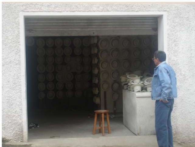
Investigación de campo en el Cantón Girón

También existe una clínica, farmacias y boticas, cabinas telefónicas, Internet y telefonía celular, tiendas de abarrotes, restaurantes de comidas típicas, tienda de fotografía y filmación y alquiler de videos, distribuidora de llantas, imprenta, panaderías y una pizzería cuyo propietario es un inmigrante que retornó hace dos años de Nueva York – USA.