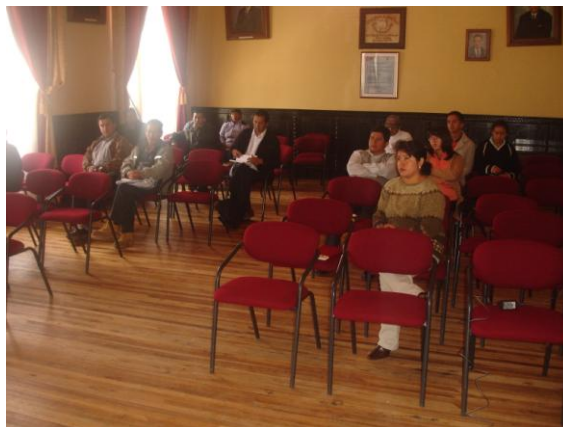
Actores en mini taller

En la Parroquia de la Asunción, están las comunidades de Pichanillas, Tejado, Chalcapa, Lentag, Corazón de Lentag, Trozana, Cochaloma, Naranjito, Rumiloma, Arushuma, Santa Rosa, la Asunción, Chilchil, Las Nieves, Lumahuco, Pueblo Viejo, Topali, Tunkay y Sedro Pugro.