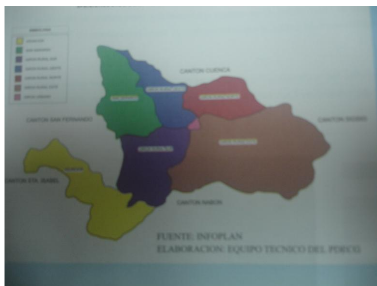
Mapa Político del Cantón Girón

El Cantón Girón de la Provincia del Azuay, tiene una superficie total de 337 Km 2 , esta situado a 37 Km. Al Sur-Occidente en la vía Cuenca-Girón-Pasaje; limitando al norte con las Parroquias de Baños, Victoria del Portete y Cumbe del Cantón Cuenca; al sur con las Parroquias Las Nieves y El Progreso del Cantón Nabón y la Parroquia La Unión del Cantón Santa Isabel; al este con la Parroquia Gima del Cantón Sigsig y al oeste con la Cabecera Cantonal de San Fernando y la Parroquia Chumblin del mismo Cantón.