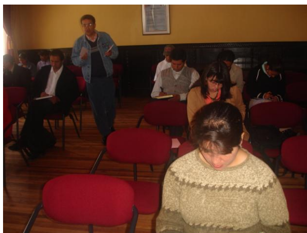
Actores en mini taller

El día jueves 13 de marzo de 2008, se procedió a la realización de mini talleres tendientes a descubrir las vocaciones productivas que dio como resultado variados tipos de negocios que los participantes creen que pueden contribuir para el desarrollo y reactivación productiva de la zona.