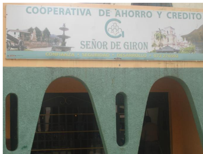
Cooperativa de Ahorro y Crédito “Señor de Girón”

Para el financiamiento de las actividades productivas se cuenta con una Sucursal del Banco de Fomento y las Cooperativas de Ahorro y Crédito “Nuestro Señor de Girón” (perteneciente a la Vicaría), La Merced y COOPAC Austro y las remesas de los migrantes. También se cuenta con el apoyo del Comité Gironense de New York “Achiras de Corazón” que financian obras como el Monumento al Migrante a un costo de USD $ 40.000,00; también con la compra de computadoras, materiales para el Hospital de Girón, adecuación de baños, compra de equipos de proyección para las escuelas y premios para eventos deportivos, entre otros.