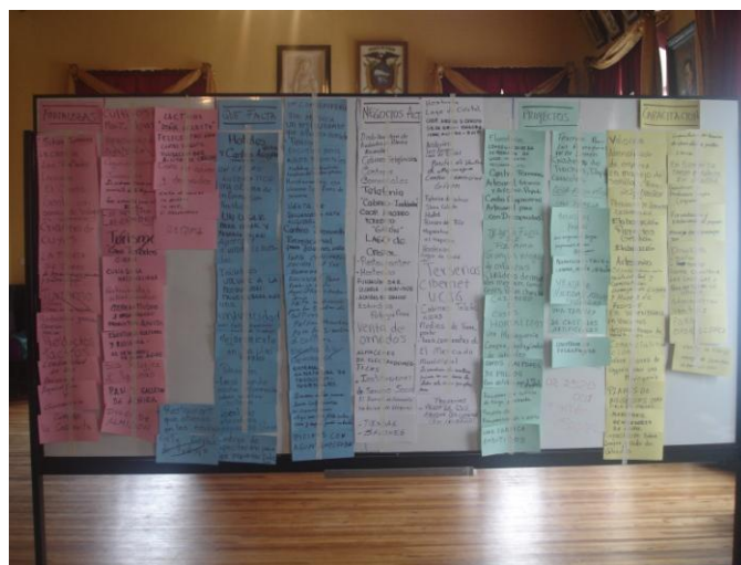
Mini Taller en la Sala de reuniones del Municipio de Girón

Se adjunta las tarjetas del Metaplan generadas en los mini talleres cuya información fue procesada en los acápites correspondientes de este informe.