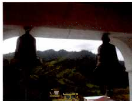
Proyectos y Capacitación propuestos en mini taller