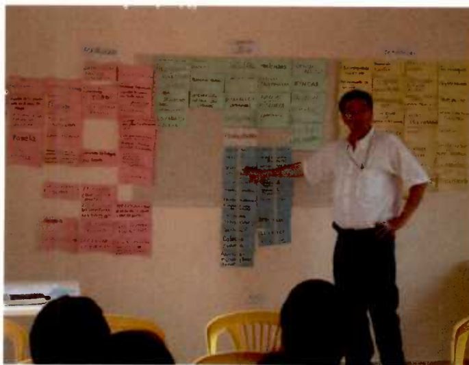
Mini Taller en la Sala de reuniones de la Junta Parroquial de Nanegal

Se adjunta las tarjetas del Metaplan generadas en los mini talleres cuya información fue procesada en los acápites correspondientes de este informe.