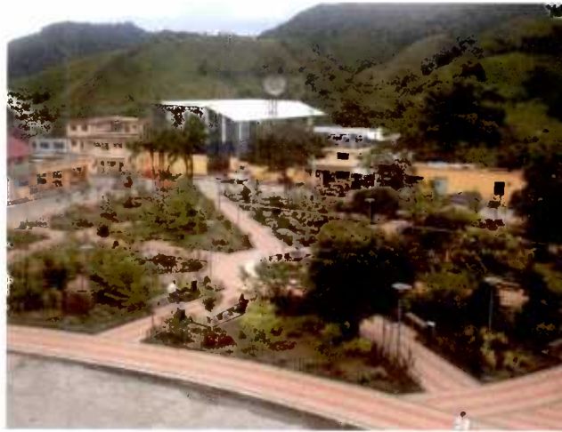
Plaza Central de Nanegal

Nanegal es una Parroquia Metropolitana Rural ó Suburbana de Quito; se encuentra a 0 grados, 15 minutos de latitud sur, a 64 Km. al noroccidente de la Capital y a 14 Km. desde Nanegalito.