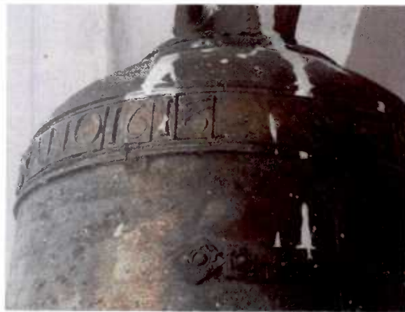
Campana Histórica de Nanegal (1618)

La Parroquia Nanegal tiene, desde tiempos remotos el nombre de Nanegal Grande, pero existen evidencias como la Campana de la Iglesia que data del año 1618 cuya inscripción denomina a la población como Nanigal palabra de origen Yumbo.