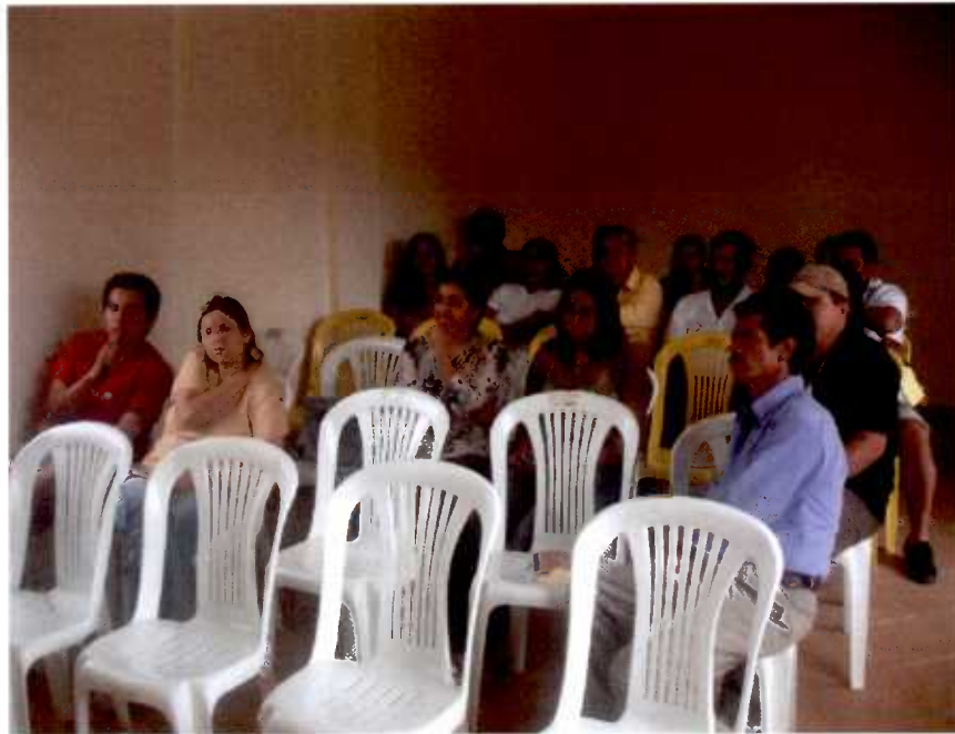
Actores en mini taller

La máxima autoridad es la Junta Parroquial que se elige por votación popular cada cuatro años. Se apoya para su trabajo en tres Juntas de Agua (Barrios Santa Marianita, Cachapata y La Delicia), Asociación de Mujeres (Cabecera Parroquial), Grupo de Mujeres Colibríes (Santa Marianita), grupo organizado de Cañicultores (Cachapata), Asociación La Perla (La Perla) y los Presidentes de los Barrios de la Parroquia en cantidad de diecisiete; y en la Cabecera Parroquial existen la Liga Deportiva, Grupo Juvenil, dos Iglesias: Católica y Pentecostal, Dispensario Médico, Jefatura de Policía y la reina de la Parroquia elegida anualmente.