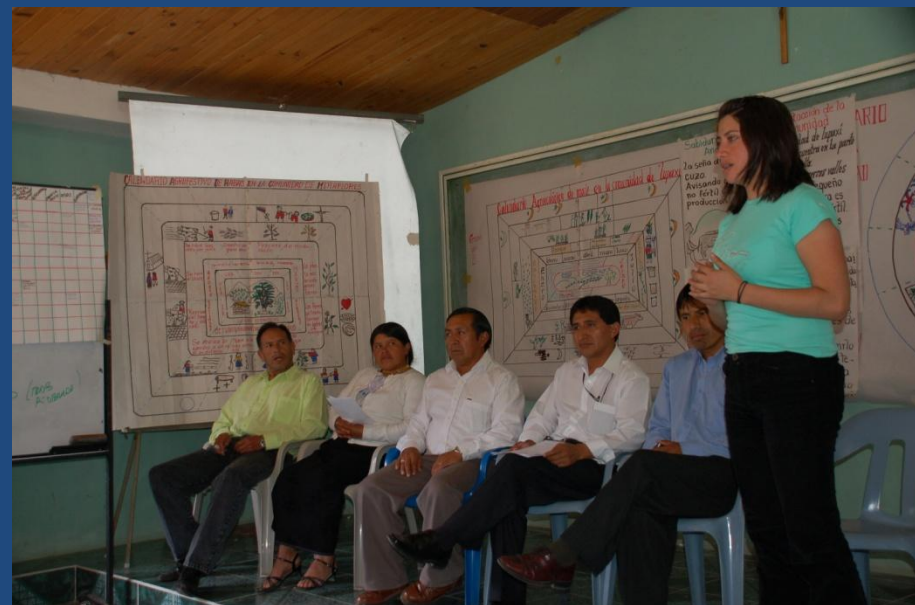
Compartir de experiencias