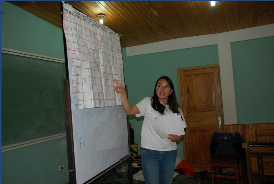
Herramientas recopilación saberes