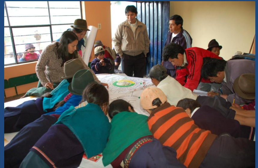
Construcción colectiva /talleres