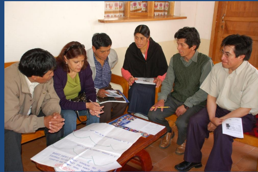
Grupos de trabajo