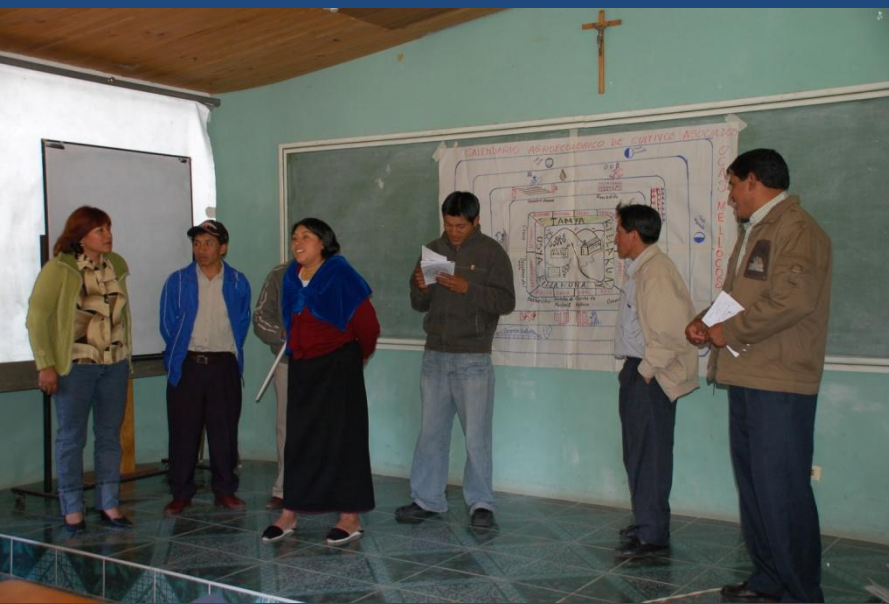
Exposición trabajos en grupo