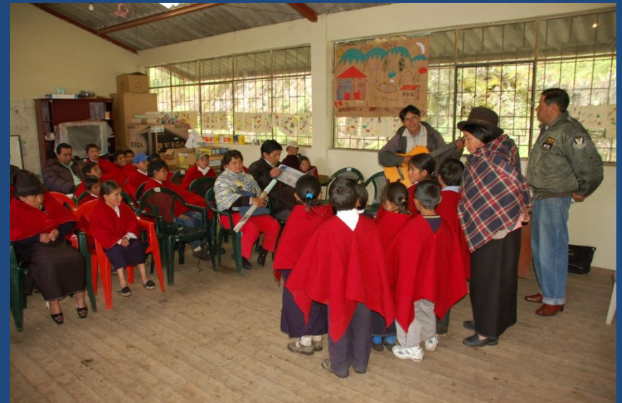
Música en Ingapirca