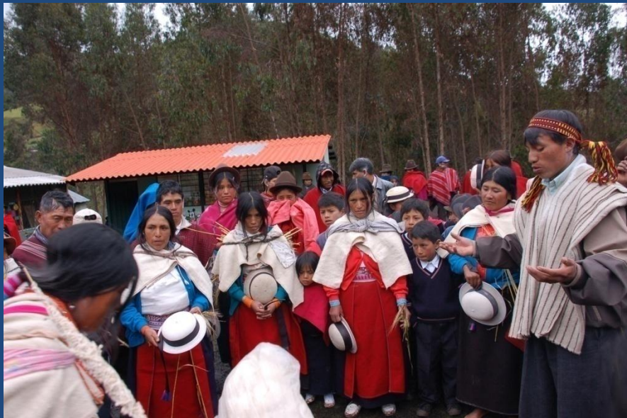
Ritual a las deidades en Estanislao Zambrano