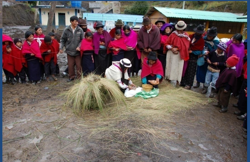
Ritual en la siembra /Velasco Ibarra