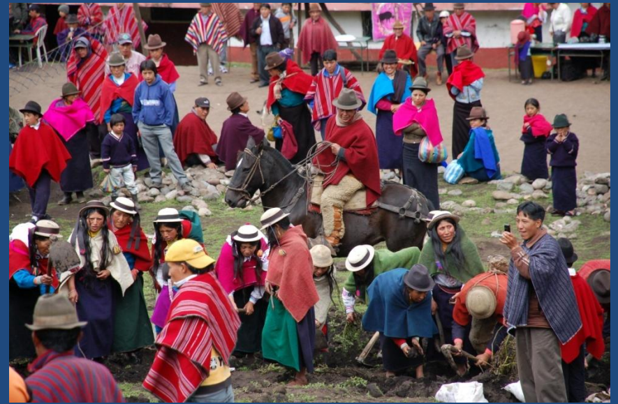
Lucha por la tierra en J. B. Dávalos