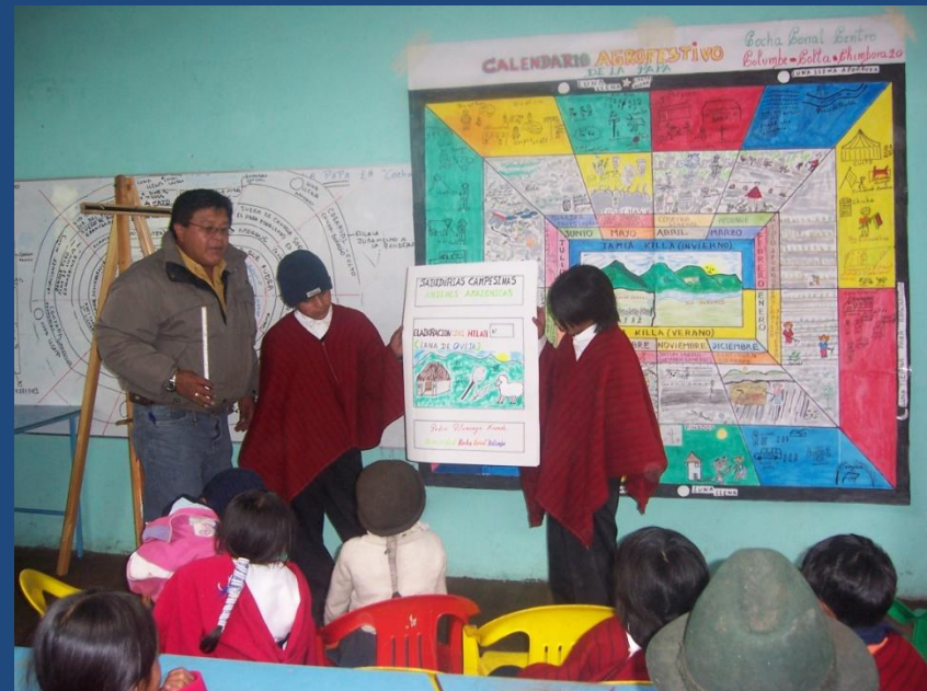
Exposición / Aprobación comunal_ Validación calendario y cartilla