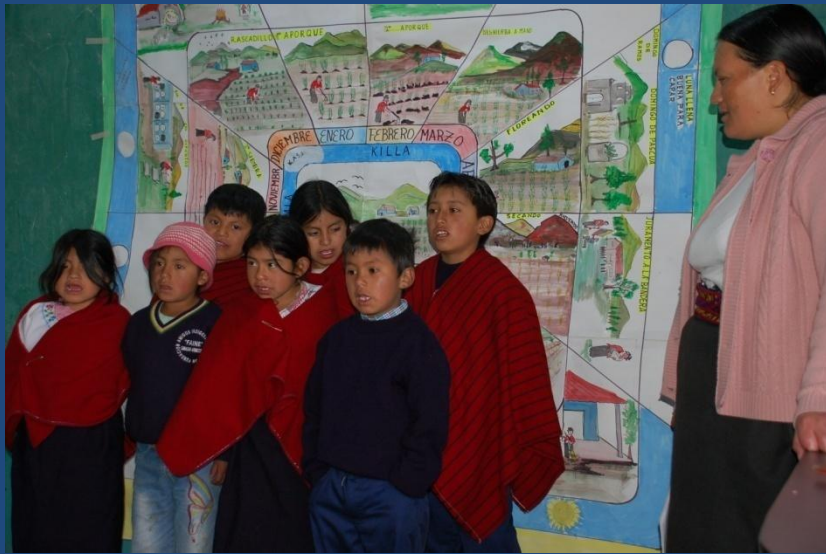
Canto en Machinasa