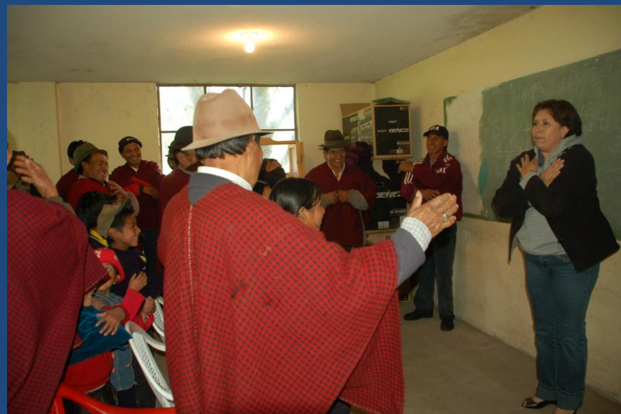
Espacios de reflexión