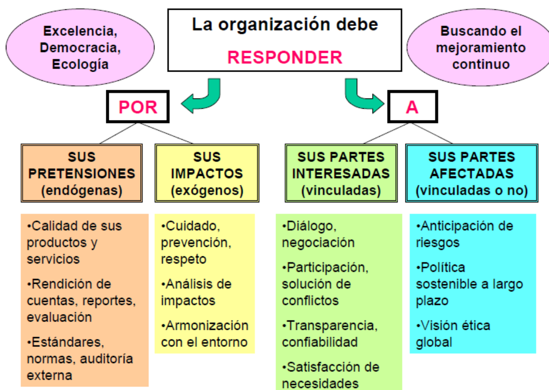
Grafico 1. Las organizaciones sociales y su ética de respuesta

Y al hablar de ética no solo nos referimos a las "intersolidaridades" sino a lo que Morin, nuevamente, llama como "intervivencias", o lo que podría ser la lucha del poder por ganar supremacía en el mundo de las organizaciones. Por tanto, al momento de responder "por" y "a", las OSC deberán reconocer estos