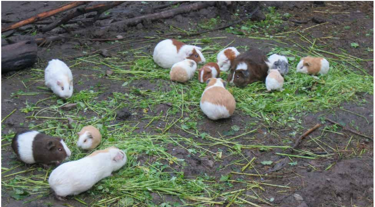
Fig. 1

En diagnósticos y estudios realizados se demuestra que en la forma tradicional de criar cuyes en las zonas rurales, estos en muchas ocasiones conviven con humanos en cocinas y/o